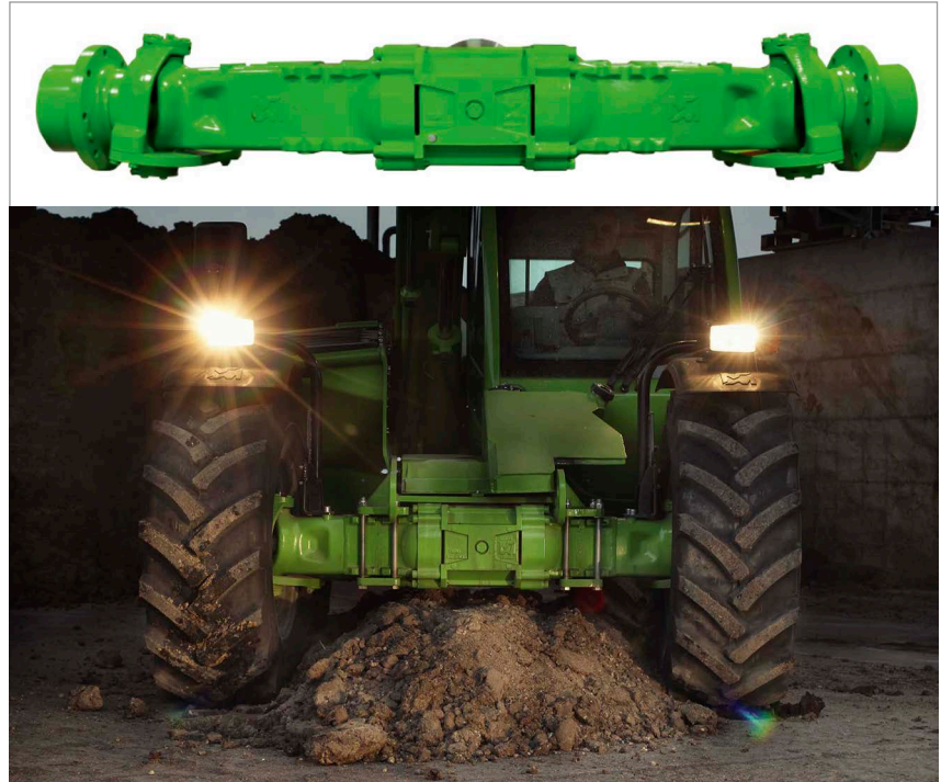
A saját fejlesztésű és gyártású tengely alatt 350 mm a szabad magasság

A Merlo a teleszkópos rakodók gémeit saját maga gyártja. Ezek rendkívül strapabíróak, ütésállóak, mégis könnyűek. Titkuk abban rejlik, hogy a semleges tengely, azaz a legkisebb terhelésnek kitett vonal mentén felhegesztett acéllemezekkel erősítik meg őket. A gép belsejében védetten futó, szabadalmazott kitolószerkezet és a hidraulikatömrlők karbantartáskor könnyen hozzáférhetők. A hidraulikus Tac-Lock reteszelésű felfo-